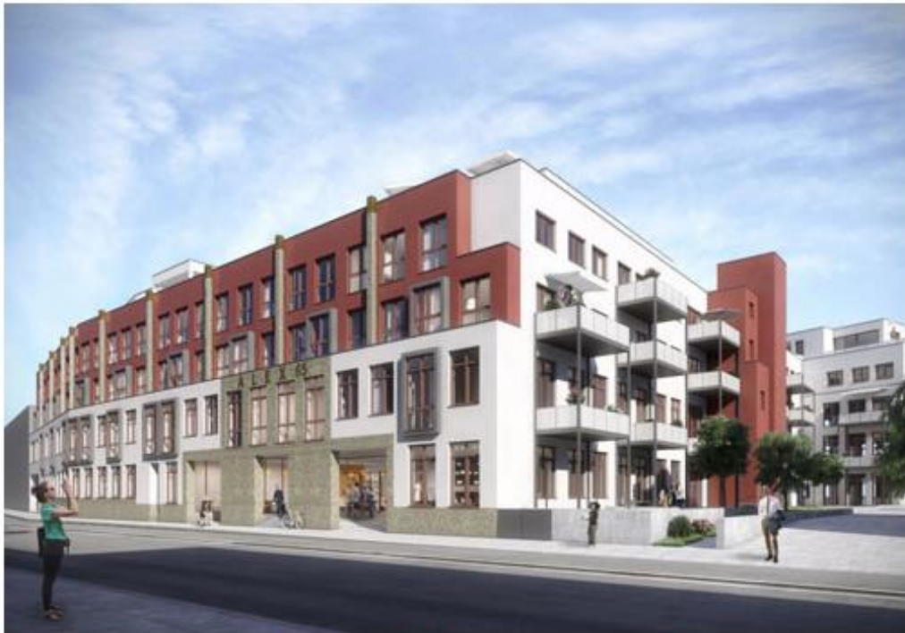
Im Herzen von Rödelheim entsteht das ALEX 65