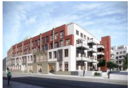
Das "Alex 65" im Frankfurter Stadtteil Rödelheim (Visualisierung: Vierte HeBa Immobilien GmbH)

Bis Mitte des 20. Jahrhunderts fertigten Arbeiter hier Fahrräder, Motorräder und Schreibmaschinen. Nun wird in den ehemaligen „Torpedo-Werken“ im Frankfurter Stadtteil Rödelheim ein neues Kapitel aufgeschlagen. In der Alexanderstraße 63-65 entstehen bis Ende 2017 im „Alex 65“ 84 Eigentumswohnungen. Bauherr ist die Vierte HeBa Immobilien GmbH.