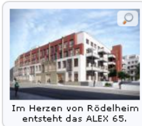
Im Herzen von Rödelheim entsteht das ALEX 65.

Pressemitteilung von: Vierte HeBa Immobilien GmbH